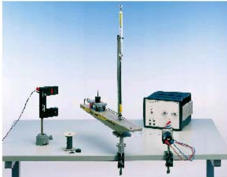
Figure 1 : Dispositif expérimental

Le dispositif expérimental (figure 1) est composé d'un système formé par un axe de rotation et d'une piste où peut coulisser une voiture ( corps d'étude). La rotation du système est commandée par un moteur à courant continu à travers une ceinture d'entraînement. Un générateur de tension continu permet de maintenir la vitesse de rotation du moteur et par suite la vitesse angulaire du système. La vitesse angulaire se déduit de la mesure de la période de révolution.